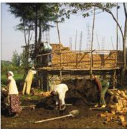
Kitchen & Dining Room Construction for Jimma School

De leden van de Caritas hebben de vastentrommel achter in de kerk klaar gezet. Er is ook ruimte voor plaatselijke acties om de opbrengst van deze actie op een passend niveau te houden. Ook in tijden van crisis hopen we dat u aan anderen, noodlijdende medemensen in Ethiopië denkt.